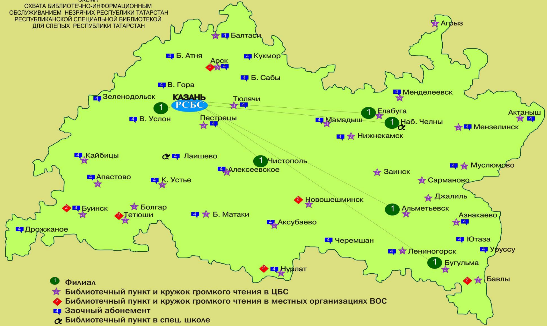
СХЕМА ОХВАТА БИБЛИОТЕЧНО-ИНФОРМАЦИОННЫМ ОБСЛУЖИВАНИЕМ НЕЗРЯЧИХ РЕСПУБЛИКИ ТАТАРСТАН РЕСПУБЛИКАНСКОЙ СПЕЦИАЛЬНОЙ БИБЛИОТЕКОЙ ДЛЯ СЛЕПЫХ РЕСПУБЛИКИ ТАТАРСТАН