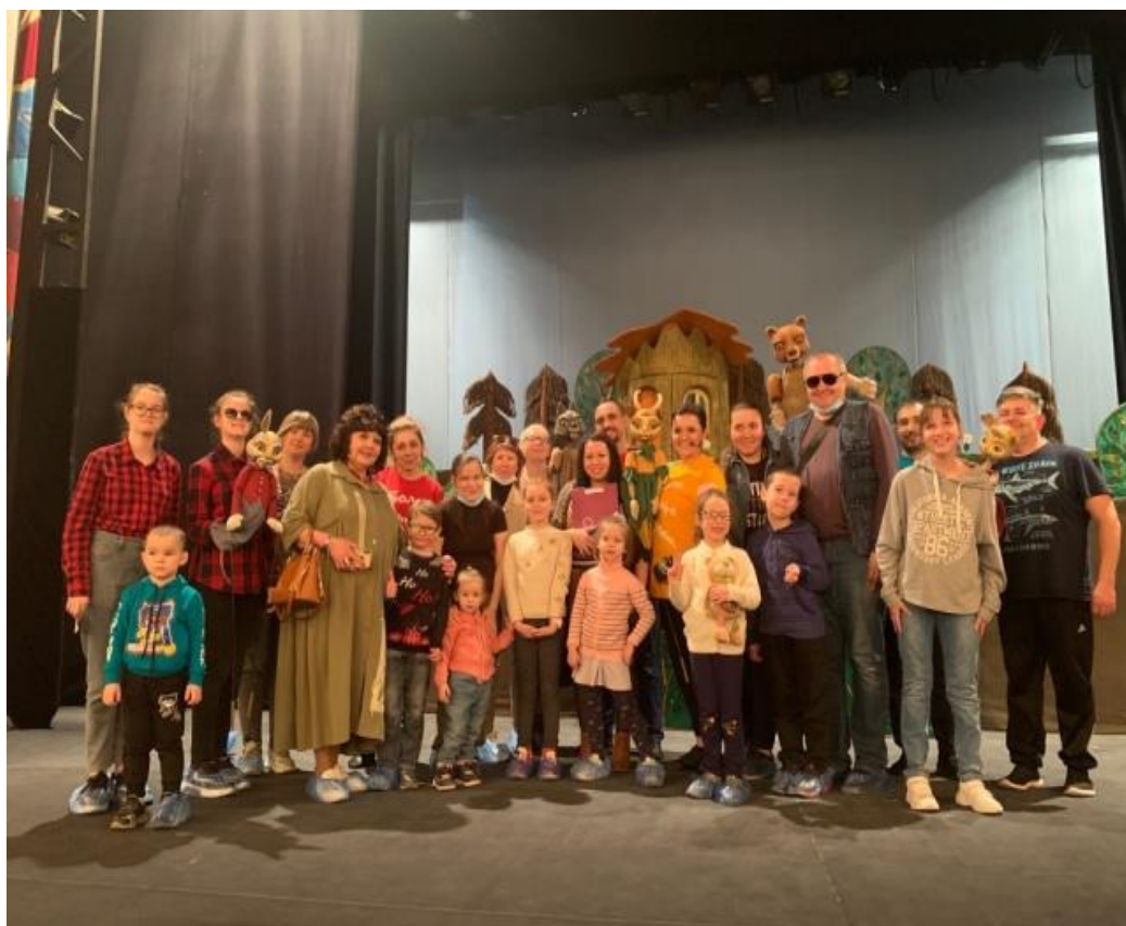
Проект «Доступное кино»

ранск, Республика Мордовия), Ульяновский молодежный театр (Ульяновск), Уфимский государственный татарский театр «Нур» (Уфа, Республика Башкортостан), Академический русский театр драмы имени Георгия Константинова (Йошкар-Ола, Республика Марий Эл).